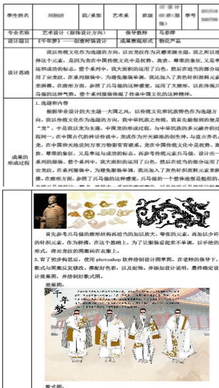
湖南民族职业学院毕业设计成果说明